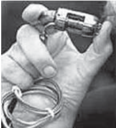
Dauerhaftes Kunstherz mit dem Namen 'Jarvik 2000'

sich Herz und Verstand nicht gut. Das heißt ganz trivial: Folgst Du deinem Herzen, ist der Verstand im Eimer oder folgst Du deinem Verstand bleibt dein Herz auf der Strecke.