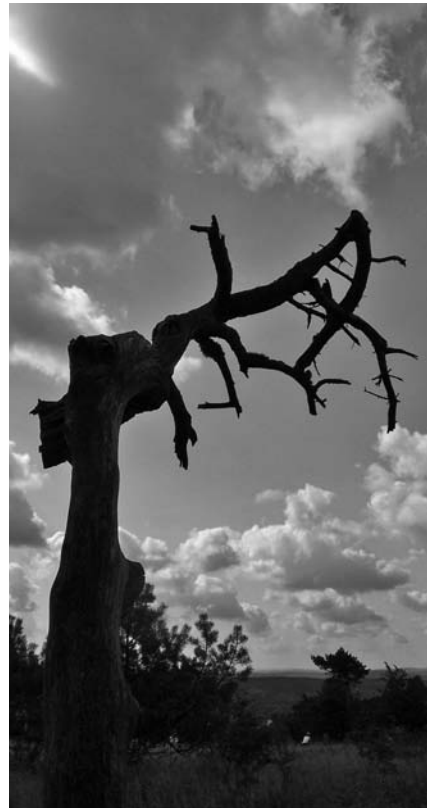
Krüppelkiefer – Kahler Asten, August 2008

auf die Mitgliederbefragung erhielten wir eine sehr große Resonanz. Eine Auswertung folgt ebenfalls in der nächsten Ausgabe der Hospiz-Nachrichten.